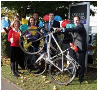
In Engeland kun je zadelhoesjes kopen om het Papworth Trust te steunen. http://bikeseatcover.co.uk De ondernemers achter deze zadelhoesjes zeggen dat ze nog vrijwel geen concurrentie hebben in Engeland. Sinds de start van hun verkoop in oktober 2008 hebben ze er circa 1200 verkocht.