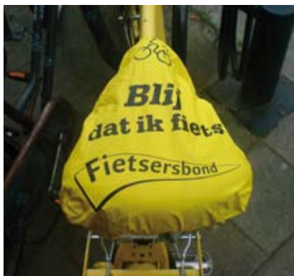
De Fietzersbond kon natuurlijk niet achterblijven