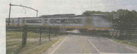
ED.nl Bekijk foto's van de verschillende routes op ed.nl/fietspad