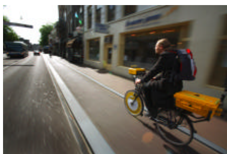
Figuur 2: De meetfiets van de Fietsersbond in actie.

Een belangrijk onderdeel van het onderzoek is een praktijkmeting in iedere gemeente voor een objectieve beoordeling van de kwaliteit van de (fiets)infrastructuur. Daarvoor wordt gebruik gemaakt van een speciaal ontwikkelde meetfiets met onder andere camera en computer (figuur 2) en van een meetauto.